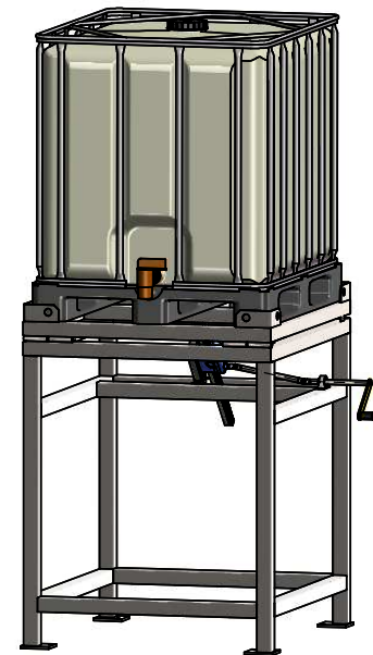
Bauhöhe ca. 1450